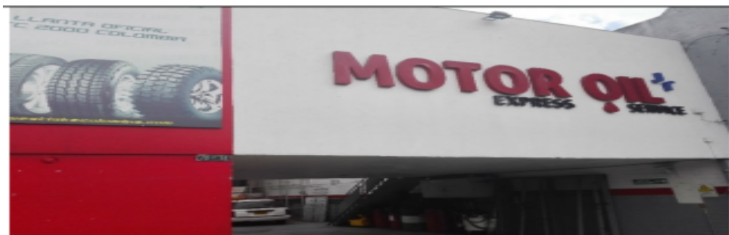
Foto No 1. Fachada del establecimiento